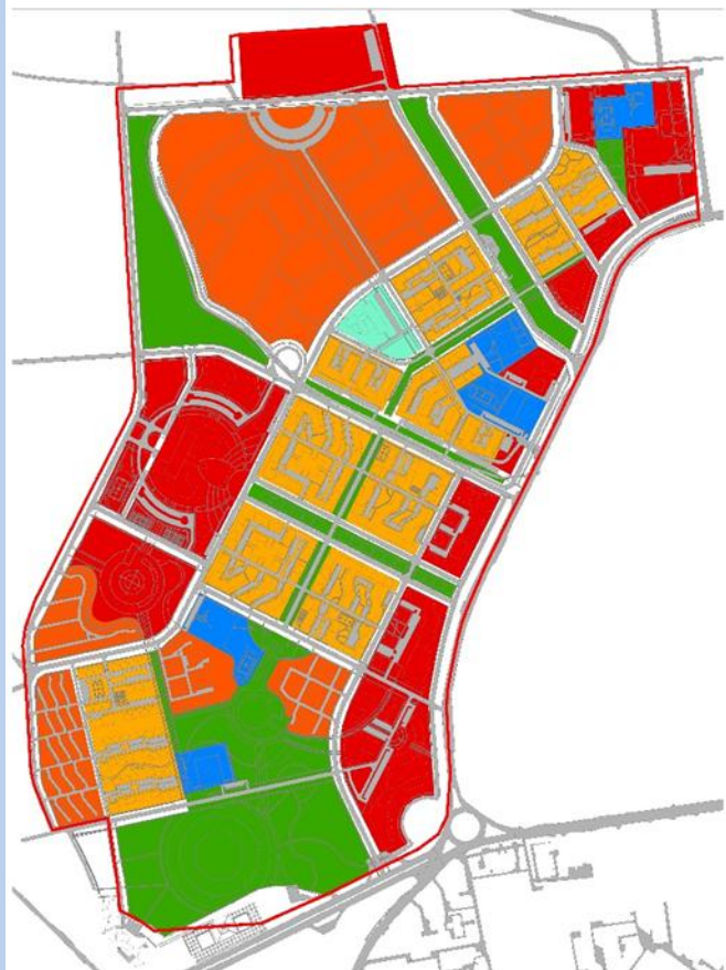
БҮСЧЛЭЛД ХАМРАГДСАН ХАШАА